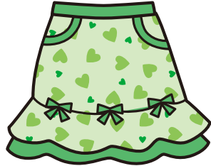
7. skirt : スカート