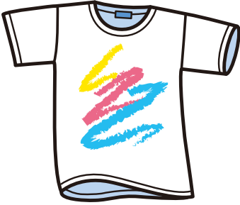
6. T-shirt : Tシャツ