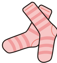
11. socks : くつした