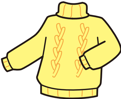
8. sweater : セーター